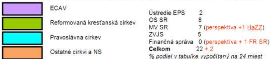
Pomerné rozdelenie vytvorených miest duchovných Ústredia EPS v OS SR a OZ SR jednotlivým RCNS, podľa čl. 28 Štatútu Ústredia